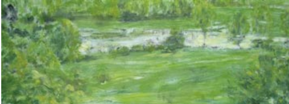
Stefaan Goethals · het eeuwenhout · acryl op paneel · 20 x 56 cm Stefaan Goethals · het eeuwenhout · acryl op paneel · 20 x 66 cm Stefaan Goethals · het eeuwenhout · acryl op paneel · 20 x 66 cm

van verheldering om wat tussen de regels van het licht morgen wordt wij zien en ruiken het gloeien van de tijd op verre heuvelruggen en hoe herhaling zichzelf herhaalt dagelijks ruimte en ongevraagd elk inzicht bepaalt, niet de leegte weegt maar het wonder van het gewone, gewoon dit landschap te laag en al te langdradig onder een lucht vol beladen wolken, reizen van regen die dit gedicht ontvolken