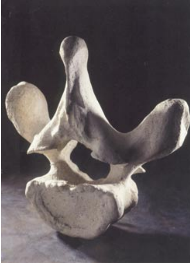
Isidoor Goddeeris · columna vertebralis · Franse witsteen · 43 x 52 x 18 cm Isidoor Goddeeris · vioolkist · mixed media · 40 x 25 x 20 cm Isidoor Goddeeris · klimmende engel · gebakken klei · 54 x 21 x 25 cm

Het tonen van ruggengraat vergroot karakter uit, staat stuk geworden stil bij steen dat ons been voorstelt en draagt.