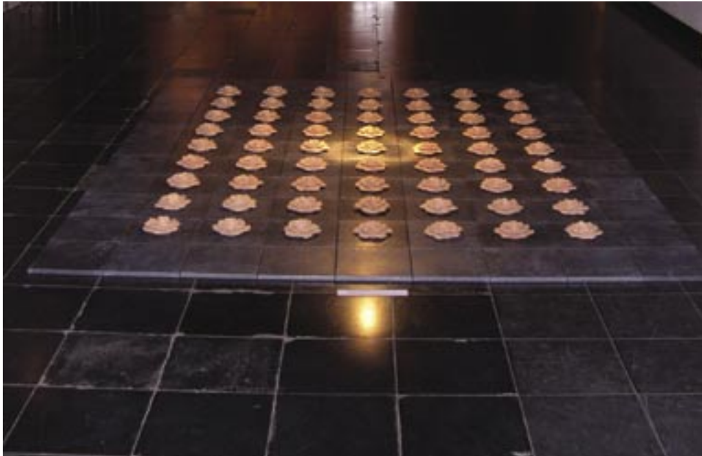
Oswald Fieuw · de weg van mijn vader · olie op doek · 200 x 128 cm Oswald Fieuw · Memorial Field · lood en terracotta · 8 x 268 x 218 cm

Tegels tonen negen elf strekse stenen voor elk zelf dat loodverbrand verstrooid werd onder van lucht het gewelf.