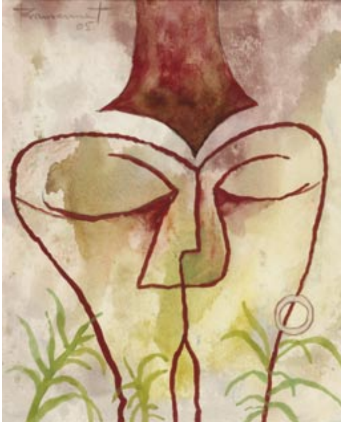
Roger Vansevenant · Hoofdberaad · gouache · 43 x 40 cm Roger Vansevenant · Groen geled verbond · gouache · 40,5 x 31 cm Roger Vansevenant · Tussen vel en vleugels · gouache · 61 x 50 cm

Wie weegt het goud in het hoofd, het lood in de ziel van zand? Drievoudig sterke planten geven groen de mens een hand.