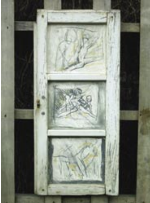
Lieve Noreille · Danspalet · assemblage · 52 x 62 cm Lieve Noreille · Zielenrust · assemblage · 41 x 41 cm Lieve Noreille · Vergane Glorie · assemblage · 100 x 100 cm