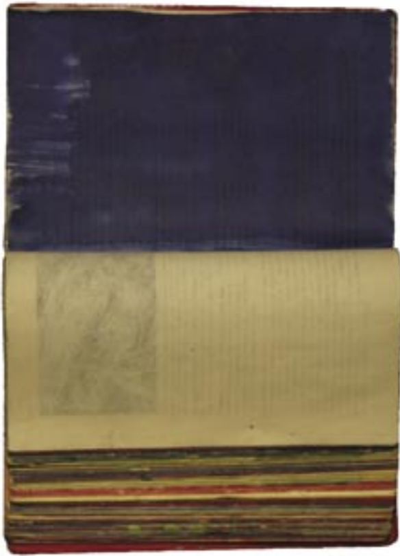
Gilbert Degryse · t.t. · mixed media 1 · 18 x 26 x 6 cm Gilbert Degryse · t.t. · mixed media 2 · 24 x 32 x 6 cm Gilbert Degryse · t.t. · mixed media 3 · 30 x 42 x 4 cm