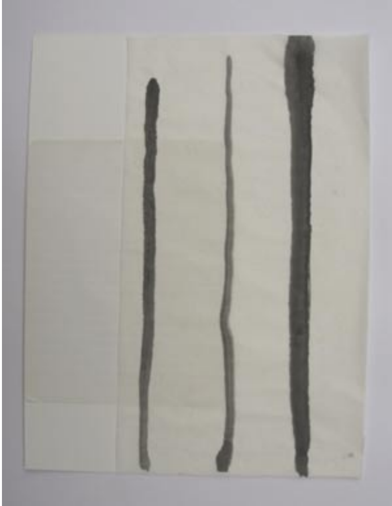
Anne Marchand · zonder titel · inkt en collage op papier 1 · 33 x 21 cm Anne Marchand · zonder titel · inkt en collage op papier 2 · 35 x 27 cm Anne Marchand · zonder titel · inkt en collage op papier 3 · 35 x 27 cm