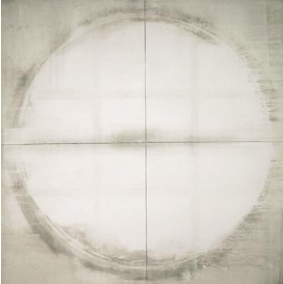
Bernard Sercu · zonder titel · olieverf op doek · 195 x 195 cm

Er ontstaat verwondering waar ik de gedachte voor me zie is de leegte zo leeg nog niet.