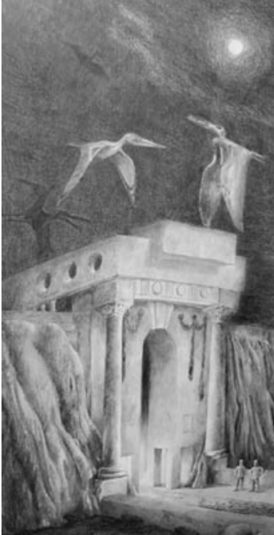
Luc Vermeersch · zonder titel · grafiet op papier · 40 X 30 cm

Het valt niet moeilyk te bewyzen dat donker zwarter is dan licht. Maar zo ongrypbaar zyn de gryzen waardoor ik twyfel aan myn zicht.