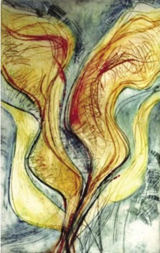
Joz Noreille · Lied van het hart · assemblage · 77 x 57,5 cm Joz Noreille · Lied van de tijd · assemblage · 77 x 57,5 cm Joz Noreille · Lied van de zee · assemblage · 77 x 57,5 cm

Lied van het hart in Woorden weerspiegeld en als 't leven gedreven