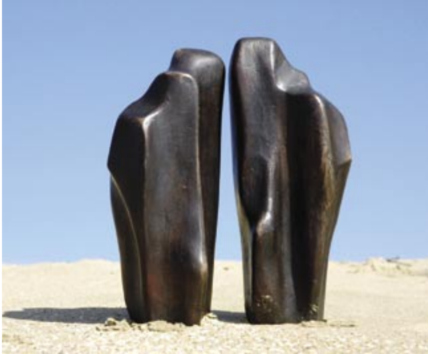
Fernand Vanderplancke · Jubileum van de liefde: Zilver-Goud-Diamant · brons (2 delen) · 40 x 25 cm Fernand Vanderplancke · The Grey Heron · brons · 40 x 25 x 20 cm Fernand Vanderplancke · Promises of a view to build a dream on · hout en brons · 90 x 50 cm

Als van Moore een monument. Gedreven zilver bekend met wat brandt. Bemind belang tot verbinden voorbestemd.