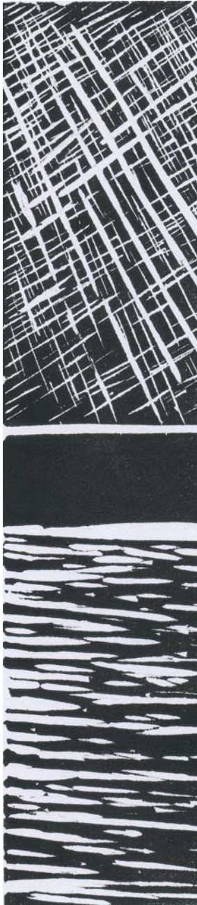
linosnede, 17 x 4 cm, 2006 Nancy Demeester

Het is het meer en het is het min. Het veel en het vaak. Het is wat in ons weegt en wat ons lichter maakt. Het is wat men verzwijgt als men spreekt. Het is wat je zegt als je niets bedoelt. Wat overblijft als men alles losgelaten heeft. Wat zich onttrekt aan tijd en taal. Het is wat zichzelf ontvreemdt. Het is wat men voor bekeken houdt als het oog zichzelf ontsloten heeft.