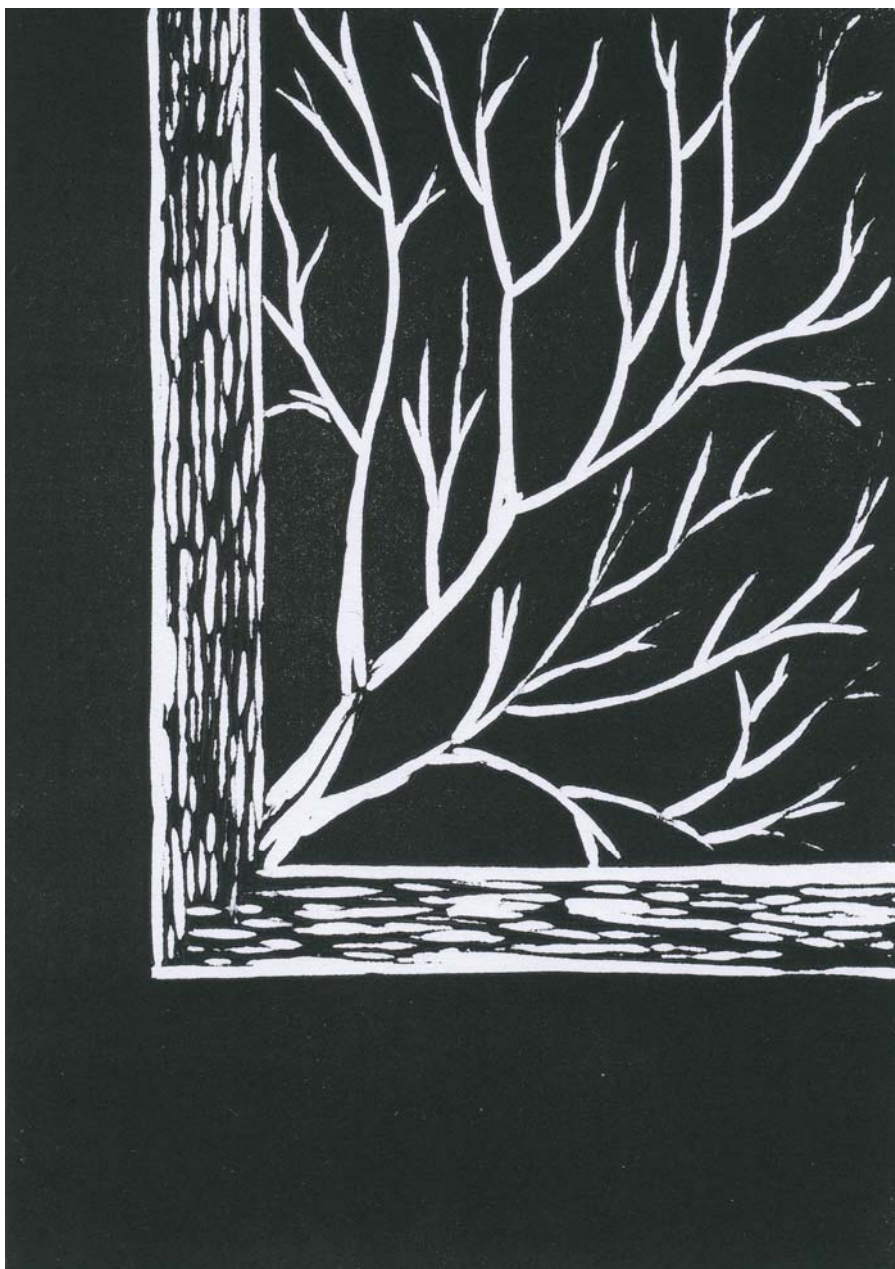
linosnede, 17 x 12 cm, 2006 Nancy Demeester

Een deur, een raam is het. Wat opengaat. Het is wat een bres in het lichaam van de ruimte slaat. Wat afglijdt en wat zich vult, is het. Het is wat je ziet als je kijkt. Wat je hoort als je zegt, hoor, het is de wind die het huis als een noot gevangen in zijn omtrek houdt. Het is wat je voelt als je daalt. Als je draalt en plotseling jezelf terugvindt terwijl je middenin het woord winter te kijken staat.